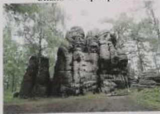
Скала Четыре брата

Уникальный геологический памятник высотой порядка 10-12 метров и площадью 75 м 2 находится на юге города Белокуриха. Если внимательно к нему присмотреться можно действительно увидеть очертания четыре мужчины, стоящих плечом к плечу. Подняться вверх и скалам можно по пешеходным дорожкам, при этом есть возможность встретить обитающих здесь бурозубую белку, рыжих птиц. С 2000 года скала и ее окрестности получили статус природоохранного памятника.