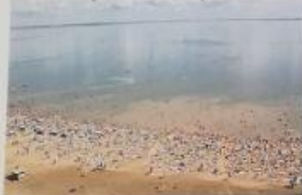
Озеро Большое Яровое

Знаменитое озеро площадью 53 км 2 расположено в Кулундинской степи, вблизи Славгорода. Воды известны своим чудодейственным свойством, которое обусловлено наличием в них целебных ионов кальция и высокоминерализованной содовой воды. Данные природные богатства с успехом используются в медицине для лечения и профилактики многих заболеваний. С этой целью на побережье озера построены санатории и бальнеологические лечебницы.