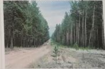
Сосновые ленточные боры

Лесные массивы, которые тянутся вдоль рек в виде лент шириной от 5 до 40 км, называют ленточными борями. На Алтае их 3, самая крупная – лента Барнаульского бора, ее протяженность вдоль Оби составляет более 400 км. Алтайские ленты лесов не имеют аналогов в мире, считается, что они образовались во времена ледникового периода. Уникальная флора и фауна этих мест привлекают, это одно из самых популярных мест отдыха у туристов.